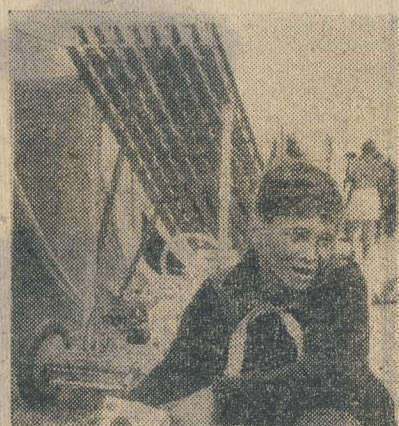
Псков. ФИНАЛ «ЗАРНИЦЫ-III».

ВОТ КАКОЕ письмо пришло в «Пионерскую правду»: